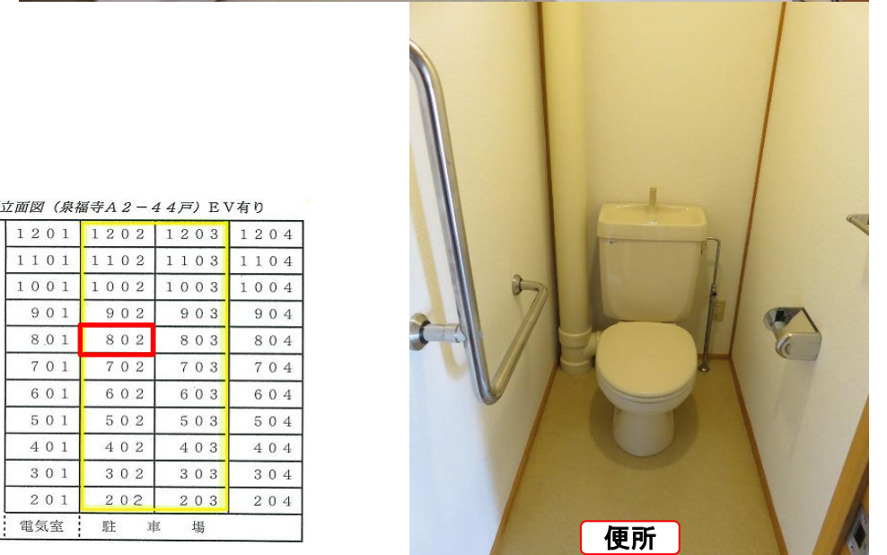
北側立面図 (泉福寺A2-44戸) EV有り