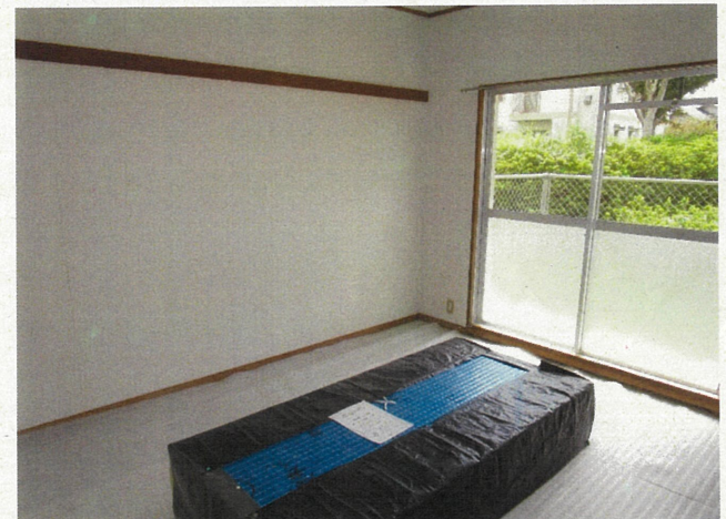
和室 (畳は入居時、敷込みの連絡をして下さい)