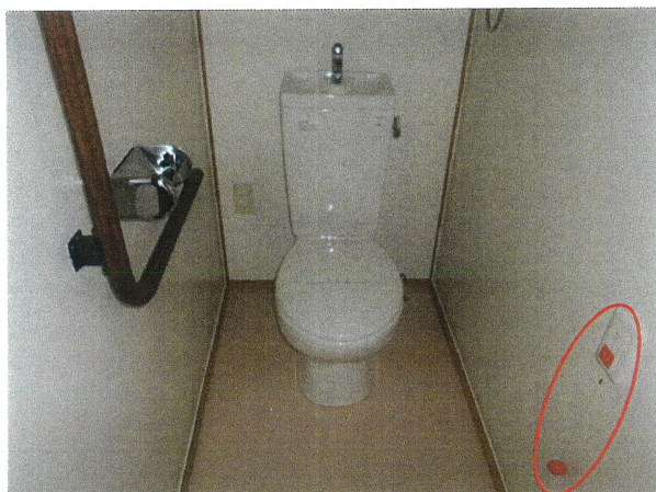
便所 (コンセント有り、赤丸は非常呼出しです)

所在地： 長崎市富士見町15-8 面積： 46.40㎡ 間取： 2DK (45, 4.2(洋), DK)