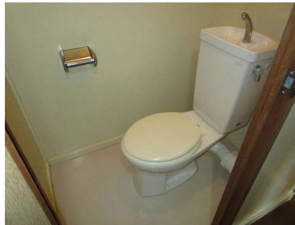
便所 (コンセントあり)