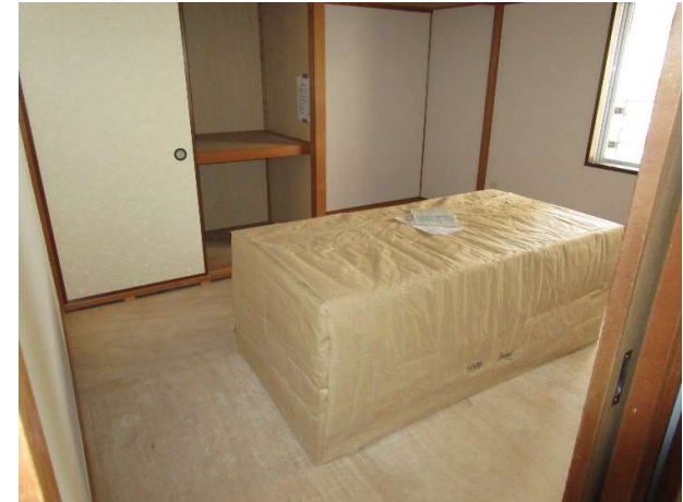
和室 (畳は入居時、敷込みの連絡をして下さい)