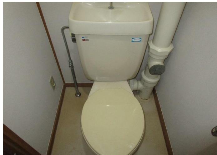
便所 (コンセント有り)