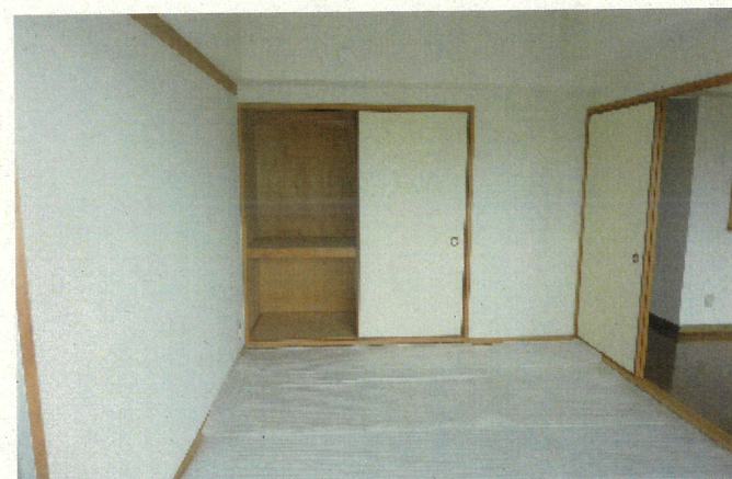
和室1 (畳は入居時、敷込みの連絡をして下さい)