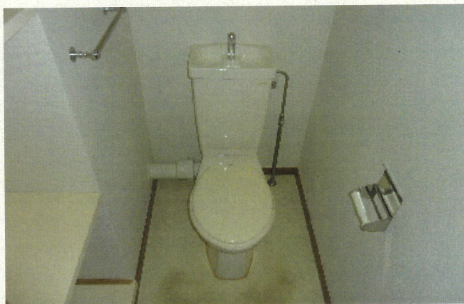
便所 (コンセント無し)