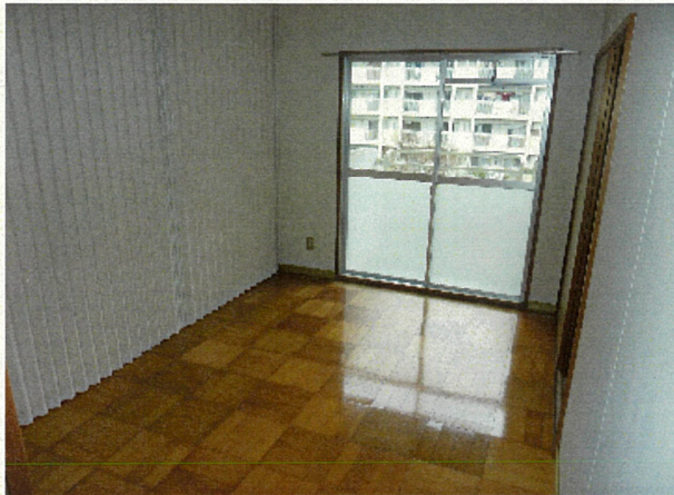
洋室(バルコニー付)