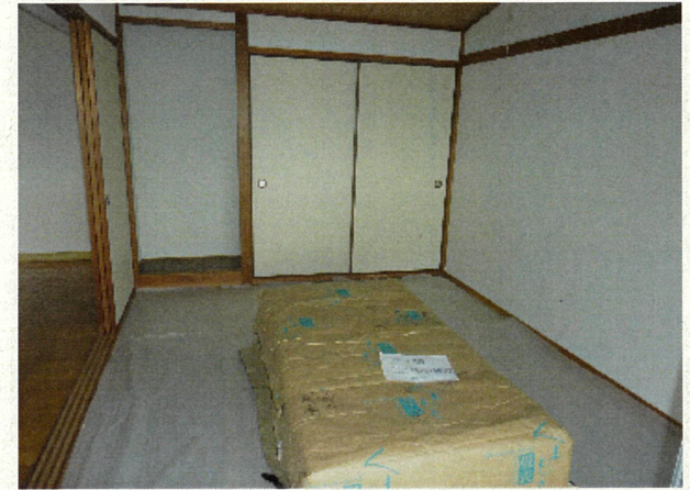
和室 (畳は入居時、敷込みの連絡をして下さい)