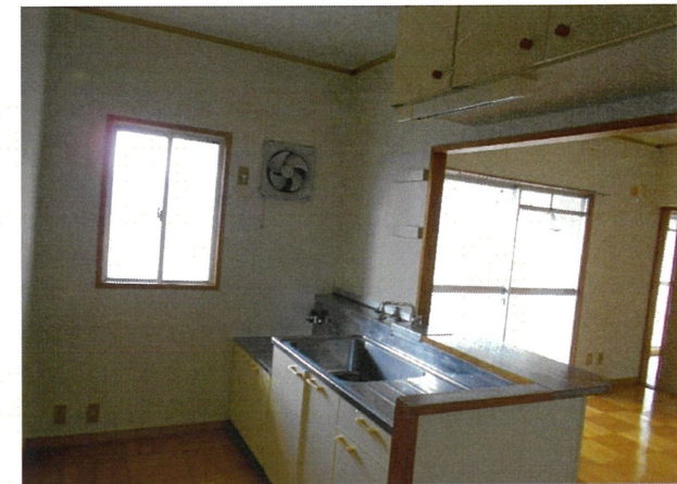
台所 (湯沸かし器は入居者設置です)