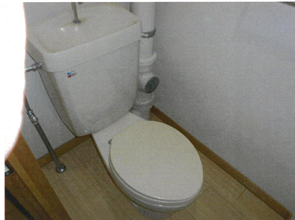
便所 (コンセント有り)

所在地： 長崎市かき道3丁目20-11 面積： 66.47㎡ 間取： 3LDK (6, 5.5(洋), 4.5(洋), LDK)