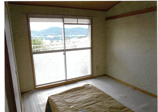
和室 (畳は入居時、敷込みの連絡をして下さい)