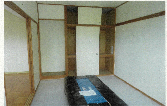
和室 (畳は入居時、敷込みの連絡をして下さい)