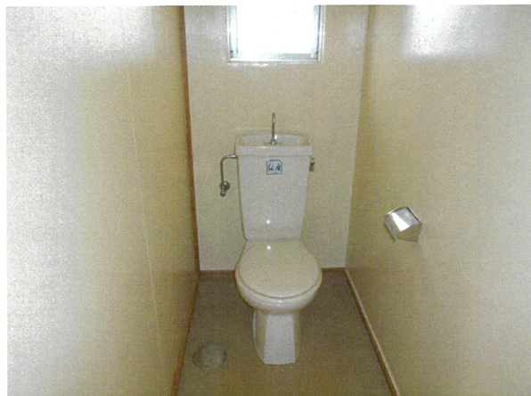
便所 (コンセント無し)