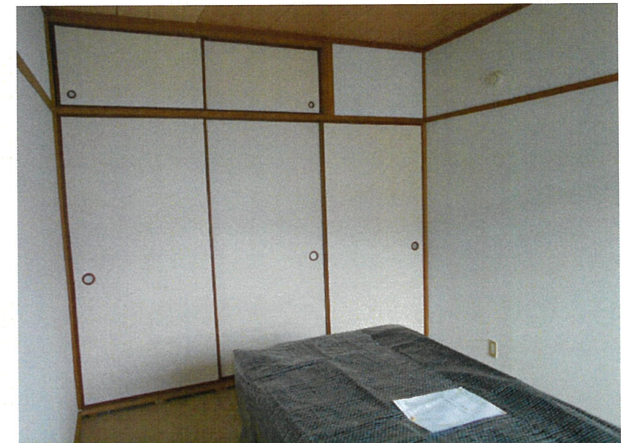
和室 (畳は入居時、敷込みの連絡をして下さい)