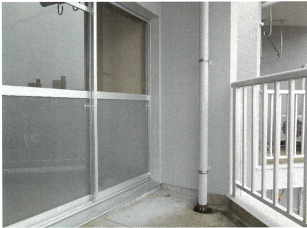
バルコニー (DKから見た)