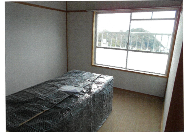
和室 (畳は入居時、敷込みの連絡をして下さい)

所在地： 長崎市かき道2丁目3-1 面積： 61.34㎡ 間取： 3DK (6, 6.45(洋), DK) 設備等： バランス釜、シャワー付 電気容量： 30A ガス種類： LPガス