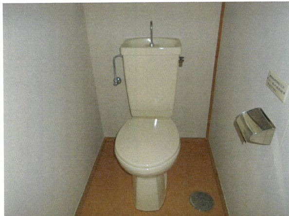
便所 (コンセント無し)

所在地： 長崎市かき道2丁目3-1 面積： 61.34㎡ 間取： 3DK (6, 6.45(洋), DK) 設備等： バランス釜、シャワー付 電気容量： 30A ガス種類： LPガス