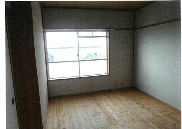
和室 (畳は入居時、敷込みの連絡をして下さい)