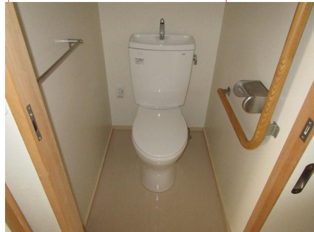
便所 (コンセント有り)

所在地： 長崎市深堀町1-293-11 面積： 73.80㎡ 間取： 3LDK (6・5(洋)・5(洋)・LDK)