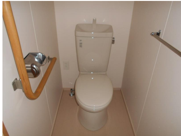
便所 (コンセント有り)