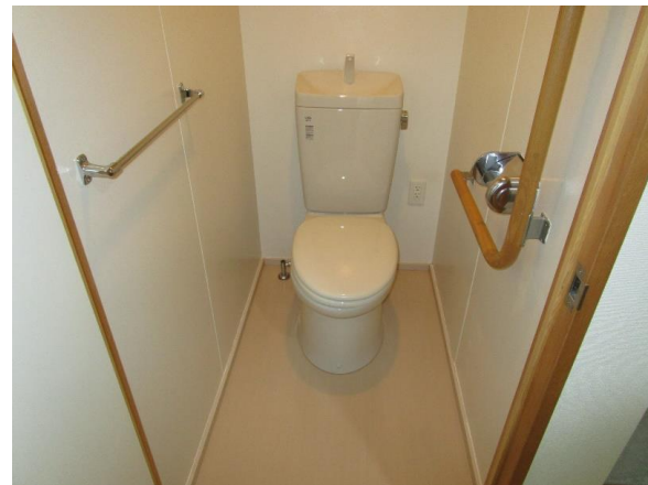
便所 (コンセントあり)