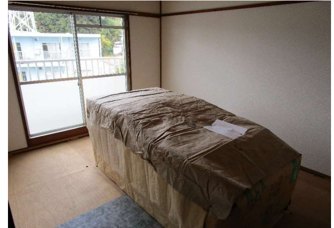
和室2 (畳は入居時、敷込みの連絡をして下さい)