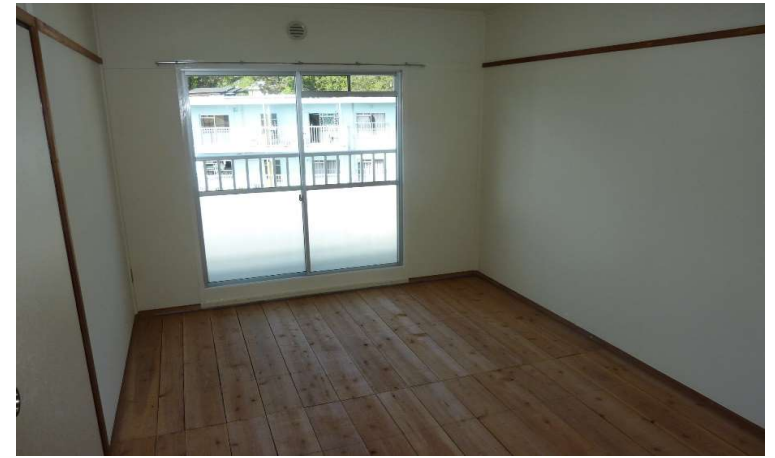
和室2 (畳は入居時、敷込みの連絡をして下さい)