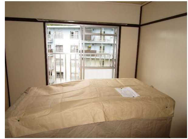
和室2 (畳は入居時、敷込みの連絡をして下さい)