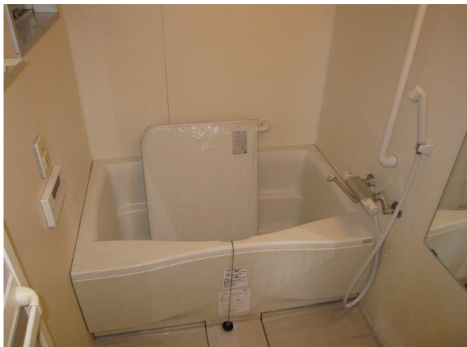
・諫早西部台団地は、お風呂「追い炊き」機能付