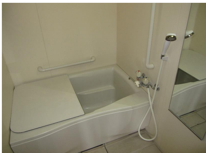
・諫早西部台団地は、お風呂「追い炊き」機能付